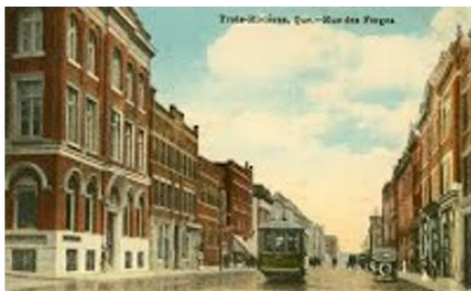
Trois-Rivières, Rue des Forges vers 1925

D'autres les ont peut-être remarqués sur quelques-uns des panneaux d'interprétation du circuit patrimonial qui fut inauguré lors des fêtes du trois cent cinquantième anniversaire de fondation de la ville, en 1984.