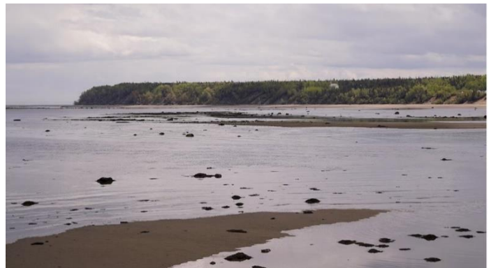
Le traité de la Grande Alliance, ou la Grande Tabagie de 1603, a eu lieu à la Pointe-aux-Alouettes de Baie-Sainte-Catherine.

Il s'agit de la coalition laurentienne, soit des représentants innus, anichinabés, malécites et autres Premières Nations de la vallée du Saint-Laurent, rassemblée pour fêter une victoire contre leurs ennemis iroquois qui les avaient forcés, quelques années plus tôt, à désertier Hochelaga, visité par Cartier en 1535.